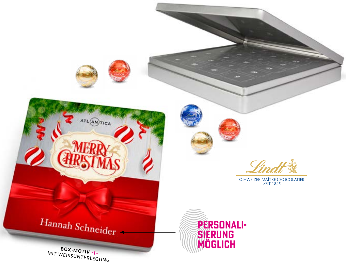
BOX-MOTIV -I- MIT WEISSUNTERLEGUNG