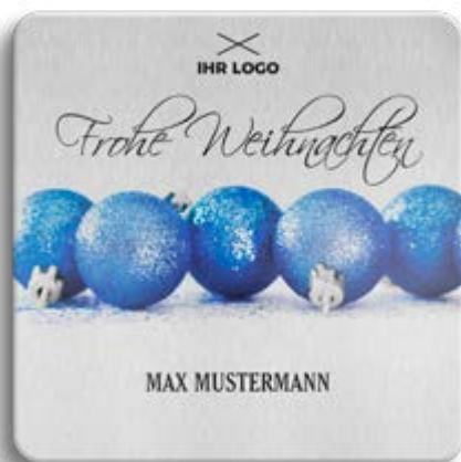
BOX-MOTIV -A- OHNE WEISSUNTERLEGUNG