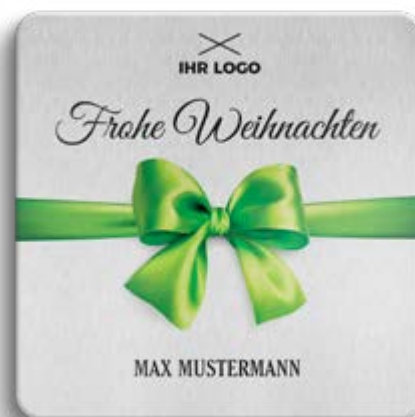
BOX-MOTIV -F- OHNE WEISSUNTERLEGUNG