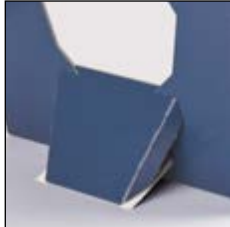
Mit ausklappbarem Tischaufsteller auf der Rückseite