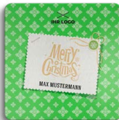
BOX-MOTIV -E- OHNE WEISSUNTERLEGUNG