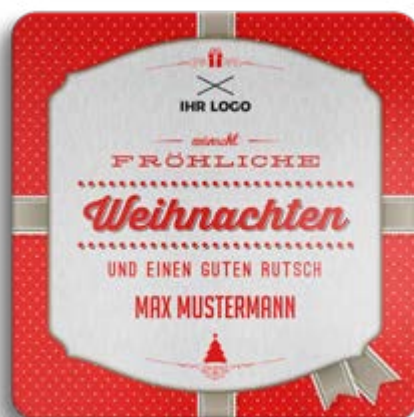
BOX-MOTIV -D- OHNE WEISSUNTERLEGUNG