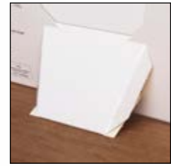
Mit ausklappbarem Tischaufsteller auf der Rückseite

Lindt SCHWEIZER MÂTRE CHOCOLATIER SEIT 1845