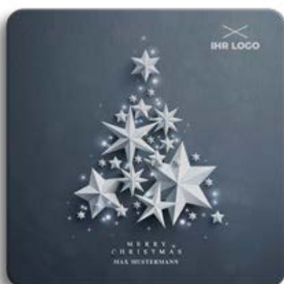
BOX-MOTIV -G- OHNE WEISSUNTERLEGUNG