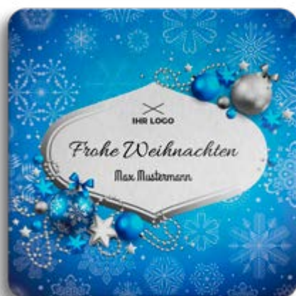
BOX-MOTIV -B- OHNE WEISSUNTERLEGUNG