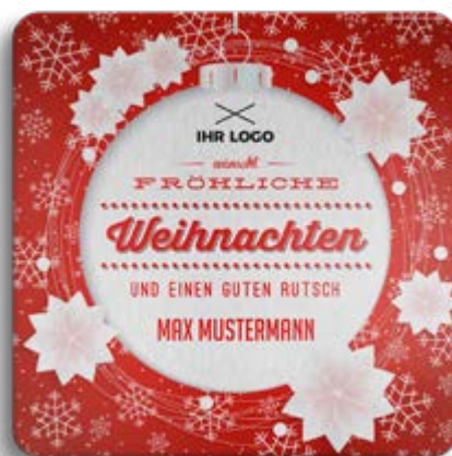
BOX-MOTIV -C- OHNE WEISSUNTERLEGUNG