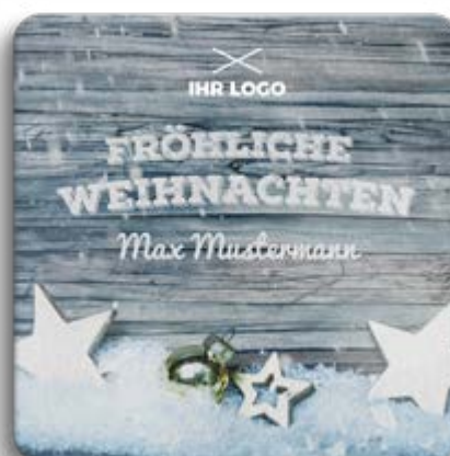
BOX-MOTIV -H- MIT WEISSUNTERLEGUNG